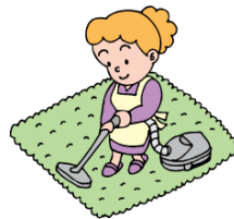
住居等の清掃 整理整頓