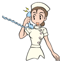
医療機関等 との連絡、通院