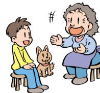
留守番、話し相手 代筆、朗読等