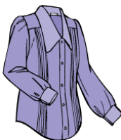
衣類のお洗濯、補修