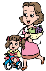
生活必需品 の買い物