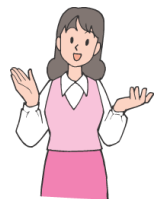
その他 (ご相談下さい)