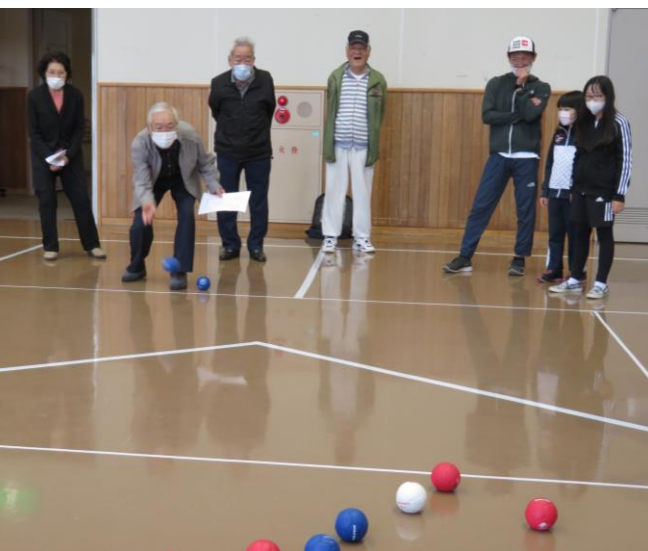
ボッチャ競技大会の様子

密にならないようにコートを2面用意して行った競技では、参加者同士ができるだけ交流を深めることができるよう、総当たりのリーグ戦を行い、敵味方関係なく素晴らしいプレーが出るとみんなで拍手を送るなど久しぶりの交流を楽しみました。