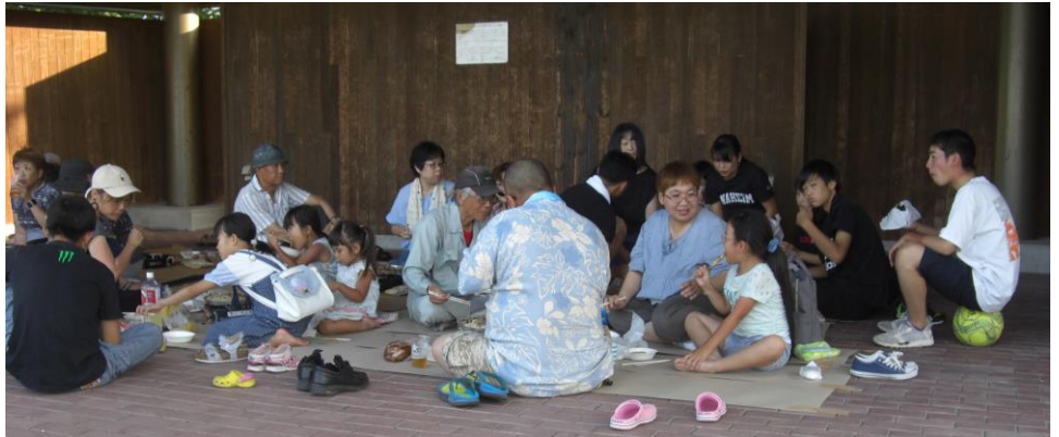
昨年の焼肉パーティーの様子

当日は4家族からのお子さんの参加もあり、子どもから高齢者まで約30名での交流となりました。